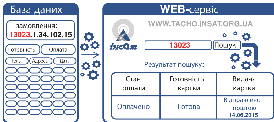
Рисунок 4. Блок-схема, за якою функціонуватиме web-сервіс після удосконалення

Для усунення недоліків існуючого web-сервісу ВКСІБ спільно з ЛДВПЕ запропоновано провести його удосконалення. Полягає воно у створенні окремого модуля системи керування базами даних (СКБД), який в автоматичному режимі синхронізуватиме дані та надаватиме замовникам актуальну інформацію 24 години на добу уп-